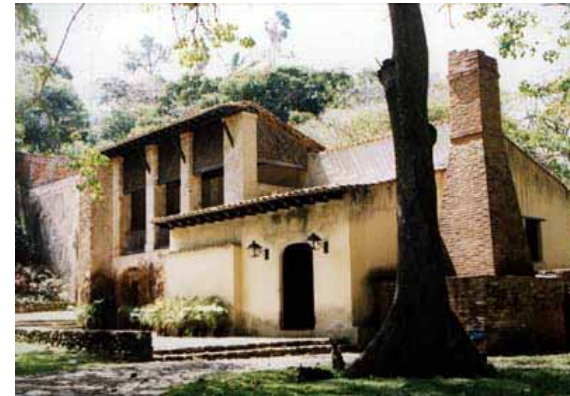
Sede del Litoral